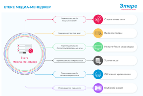
Этере Перенос данных